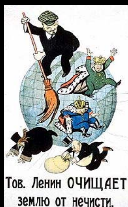
Σοβιετική αφίσα του 1920. "Ο σύντροφος Λένιν καθαρίζει τη γη από τη λέρα"

Ο σοσιαλισμός επιβάλλοντας τις παραπάνω σχέσεις παραγωγής απελευθερώνει τις παραγωγικές δυνάμεις της κοινωνίας, που θα αναπτυχθούν σε ένα πολύ ανώτερο επίπεδο. Η ανάπτυξη των παραγωγικών δυνάμεων, σε συνδυασμό με τη νέα κοινωνική διαπαιδαγώγηση που θα επέλθει ως αποτέλεσμα τα κοινωνικών σχέσεων, θα οδηγήσει με τη σειρά της σε μια υπεραφθονία υλικών αγαθών, σε μια νέα έκρηξη των παραγωγικών δυνάμεων. Στο νέο εκείνο κοινωνικό στάδιο, στην ανώτερη φάση, το κάθε μέλος κοινωνίας θα προσφέρει ανάλογα με τις δυνατότητές του και θα αμείβεται ανάλογα με τις ανάγκες του κράτος, που είναι ένας καταπιεστικός μηχανισμός στα χέρια της κυρίαρχης τάξης, μετά την είσοδο στο σοσιαλισμό, θα αρχίσει να φθίνει. Ο μαρασμός του κράτους θα ολοκληρωθεί στην ανώτερη φάση του κομμουνιστικής κοινωνίας. Η κρατική καταπίεση θα αντικατασταθεί τότε από τη συλλογική διαχείριση συνόλου των μελών της κοινωνίας.