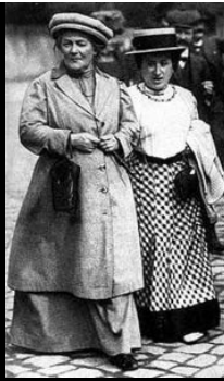
Κλάρα Τσέτκιν και Ρόζα Λούξεμπουργκ